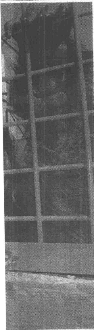
הצורך כי אין קשר בין עיסוקו בחי פארק לבין המתחמים שבנידול נדרשתו יאל פרידה